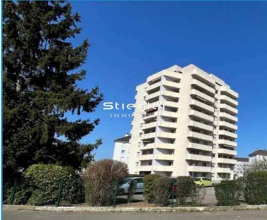
Immeuble - vue extérieure