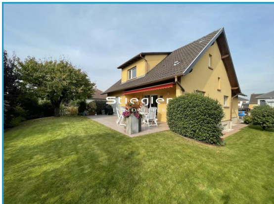
Vue sur jardin

Référence VM338, Mandat N°18462 LINGOLSHEIM, Maison 6 pièces de standing.